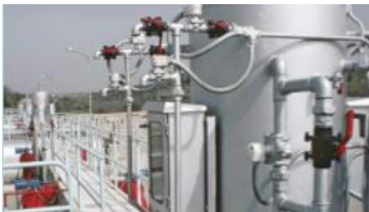
Fotografía 1. Time New Roman 8 negrilla

Las tablas se numerarán indicando su contenido en la cabecera de la misma, comenzando con la palabra "Tabla" y a continuación el número que le corresponda, un punto y enseguida el título. El tamaño máximo del texto y símbolos en las tablas es de 8 puntos. Pueden emplearse colores en las tablas. Si resultan indispensables y sustanciales en relación con el contenido del artículo, podrán incluirse figuras, fotografías o tablas de ancho mayor, las cuales deberán centrarse en la página.